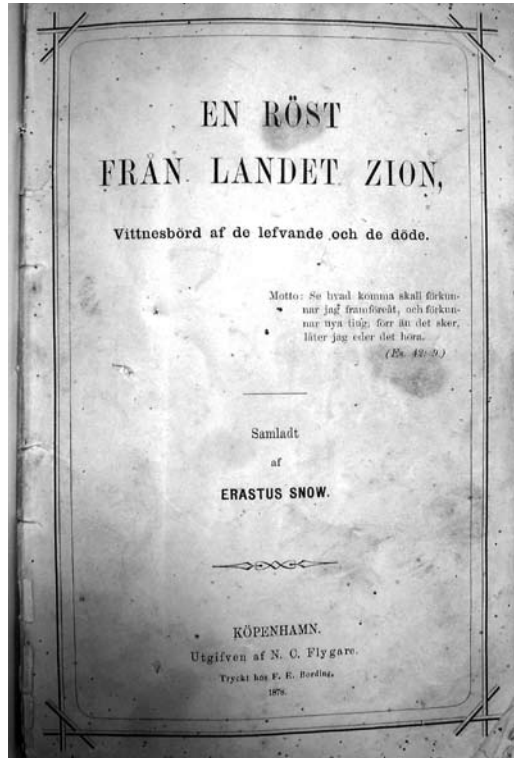
Mormonilehtinen En röst från landet Zion.

salaista mormonilehti Nordstjernania ja opillisia perusteoksia joillekin ihmisille. 28 Lisäksi Pohjassa oli liikkeellä käännytyskirjallisuudeksi luokiteltavia lehtisiä en röst från landet Zion ja En sannings röst till de uppriktiga af hjertat. 29 Blom oli yhtäältä tarjonnut tällaista kirjallisuutta ihmisille, toisaalta jotkut olivat pyytäneet sitä häneltä.